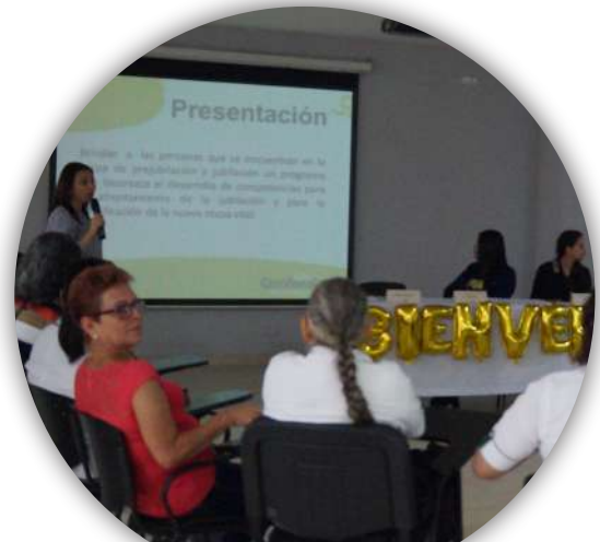
Programa para pensionados

De igual forma, se ejecutó el proyecto “Entornos Laborales” que impactó 86 oficinas del departamento y 5 procesos de la Sede Administrativa, trabajando desde diferentes líneas de intervención que permitieron mejorar el ambiente laboral.